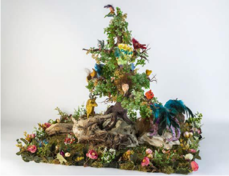
Güzel ve Çirkin (Aslan ve Ceylan), 2020,