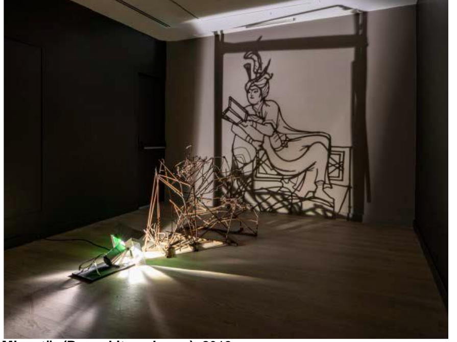
Minyatür (Prens kitap okuyor), 2013,