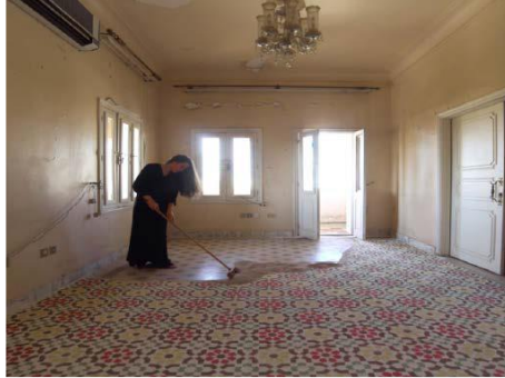
Dana Awartani - Uzaklaştım ve Seni Unuttum(2017)