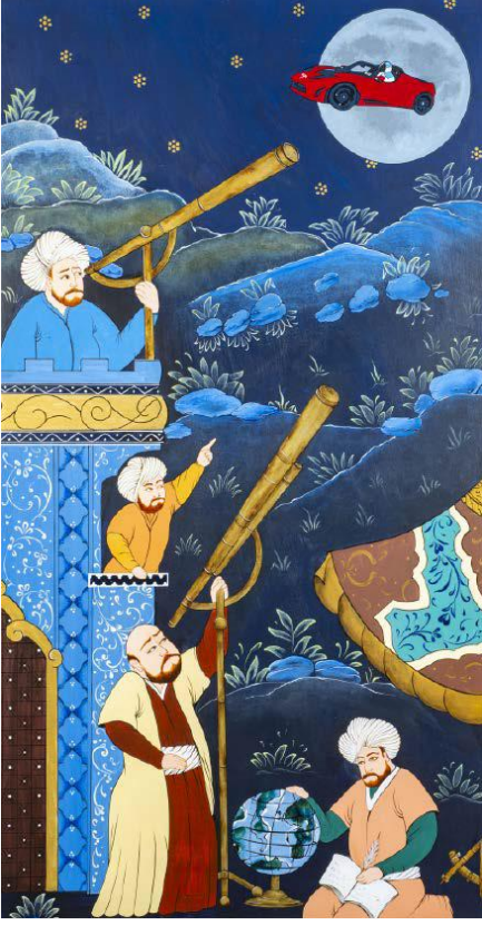
Halil Altındere - Tesla to the Moon (2019)